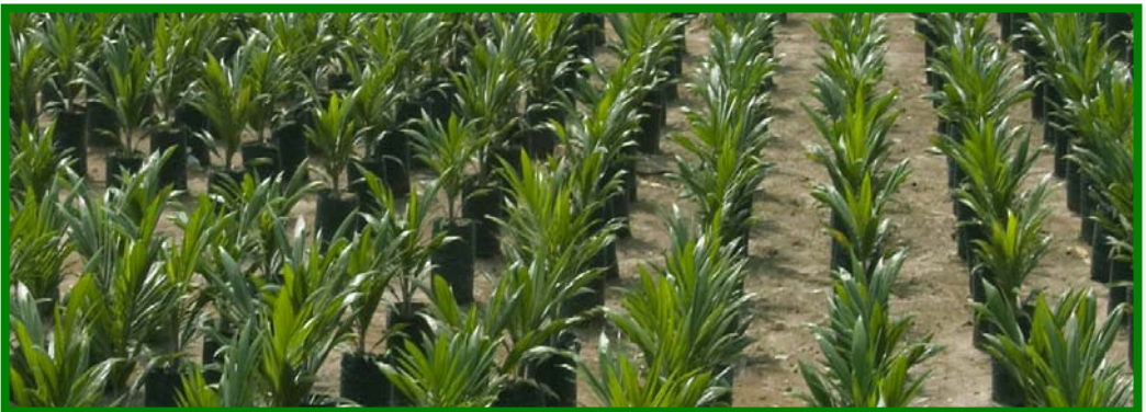
Milik PT. Perkebunan Nusantara III (Persero)